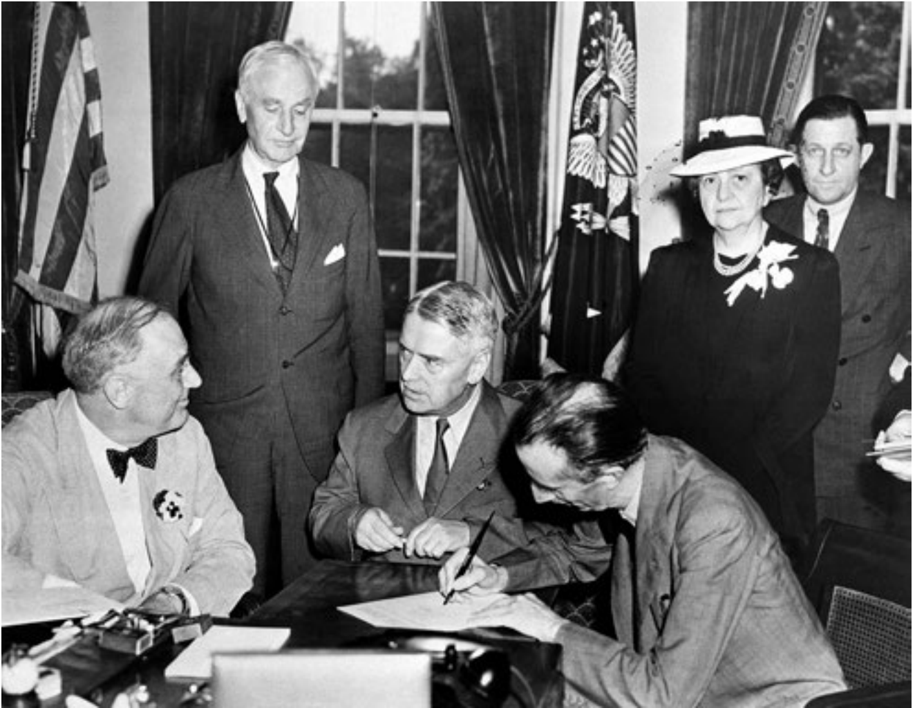
President Roosevelt bevittrar undertecknandet av ILO-deklarationerna för världsekonomisk säkerhet i Vita huset den 17 maj 1944. Från vänster, sittandes, Roosevelt, Walter Nash, minister från Nya Zeeland och president för den nyligen genomförda ILO Philadelphia-konferensen, Edward J. Phelan, fungerande direktör för ILO, signerandes: utrikesminister Cordell Hull (vänster) och arbetsmarknadsminister Frances Perkins står.